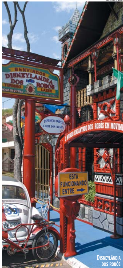
DISNEYLÂNDIA DOS ROBÔS

Na hidráulica, é possível observar o funcionamento de uma Roda d'Água. O engenheiro explica que o equipamento permite entender que a circulação contínua desse sistema de bombeamento entre duas piscinas depende da pressão da água.