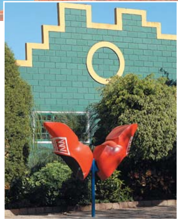
Elementos da cultura holandesa por todos os lados

gérberas para decorar suas casas", explica Fernandes. Para participar, é preciso comprar um kit contendo uma base floral, cinco hastes de flor, juncos e folhagem verde - tudo por R$ 8,00.