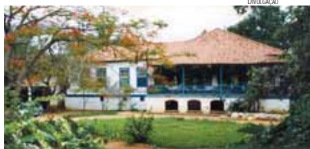
Em Mococa, passeios noturnos são a atração

lômetros", conta. "A partir daí, atravessamos outras fazendas." Aos grupos, que somam até 18 pessoas, são fornecidos cavalos já encilhados.