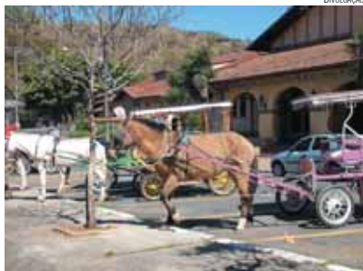
Charretes são famosas em Poços de Caldas

Trilhas de Caconde permitem passeio até para crianças