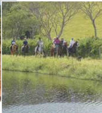
ESTUDIO EMERSON ARAUJO