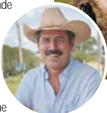
Participantes da Cuecada têm experiência sobre cavalo; no destaque, o presidente da Sociedade de Esportes Hípicos