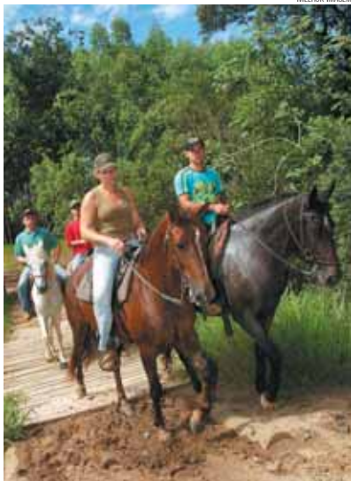
Em Holambra, monitores orientam iniciantes na montaria

mente brasileiro, mas tem um toque da culinária holandesa.