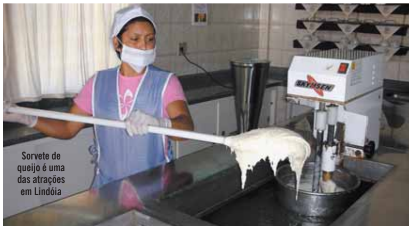
Sorvete de queijo é uma das atrações em Lindóia

ato de preparar pratos de forma artesanal, um recado para quem visita essas cidades é "sua presença é importante para nós".