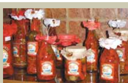
Geléias de pimenta e mexerica e pasta de berinjela são algumas das delícias de Caconde