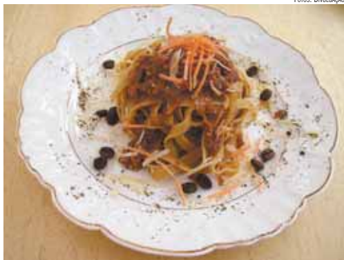
Pasta da Serra é o prato oficial de Serra Negra

Hoje, em Jaguariúna, a receita faz homenagem à Maria Fumaça, trem que renasceu para o turismo com a extensão do trecho entre o rio Jaguari e a antiga estação final, na entra-