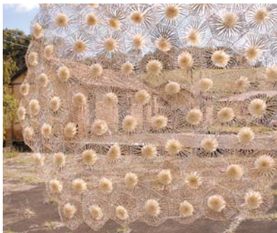
Toalha de mesa: uso de fibras naturais

De acordo com a vice-presidente da Cadesp, as folhas de árvore - como as do abacateiro e magnólia - são colhidas e têm retiradas a clorofila. Passam, então, por lavagem e secagem até ficarem com tons naturais. "Com isso, montamos flores que podem ter várias utilidades, como arranjos e broches", sugere. ▶