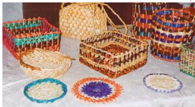
Matéria-prima da cestaria: descarte da natureza

Segundo a assessoria de imprensa da prefeitura, o sítio cria as ovelhas, espera seu