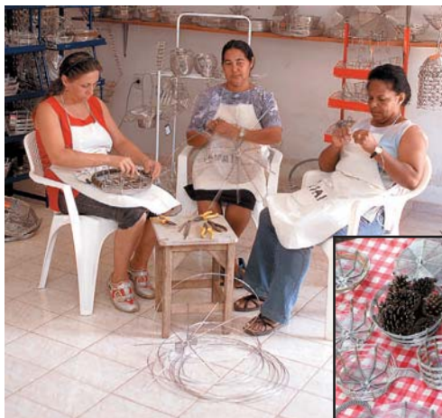
Artesãs de Ataí: matéria-prima do trabalho é arame de alumínio