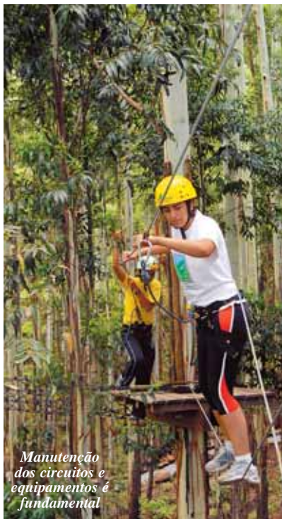
Manutenção dos circuitos e equipamentos é fundamental

Bem, quem ainda não se sentir pronto para praticar aventura, seja por coragem insuficiente, seja por falta de disposição, pode recorrer a algumas alternativas. No Sítio Caminho da Serra, por exemplo, é possível avistar todos os passos dados pelos amigos nos circuitos de arvorismo deitados nos redários - espaços com redes para descanso. Você vai querer ficar na rede? ►