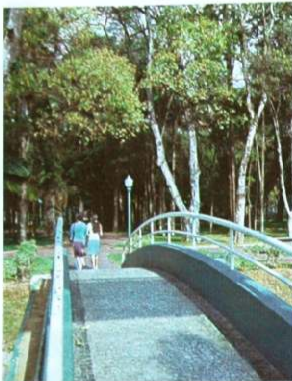
Parque Junqueira é um dos locais mais visitados de Poços de Caldas