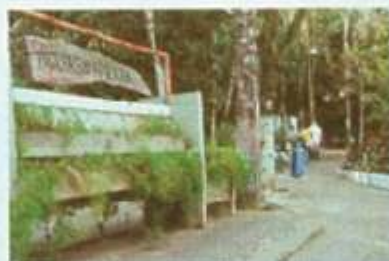
Mata virgem em Águas da Prata

Estátua do Cristo também pode ser vista no Parque Interlagos, em Aguaí. A área possui pista de cooper, playground, campo de fute-