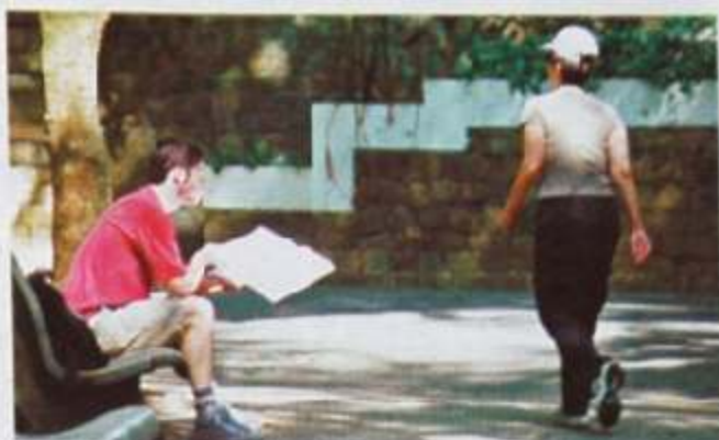
Reserva natural no centro de Campinas atrai adeptos de caminhadas (acima) e grupos de estudantes (abaixo)

Em Campinas, ainda há o Lago do Café - área de 330 mil m 2 , que abriga o Espaço Permanente do Artesanato -, o Bosque dos Alemães - que possui árvores naturais como