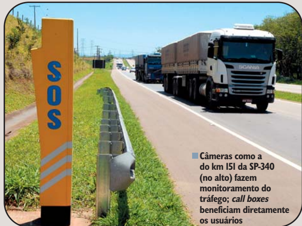
■ Câmeras como a do km 151 da SP-340 (no alto) fazem monitoramento do tráfego; call boxes beneficiam diretamente os usuários

cação também foram trocados por digitais. Com isso, é possível agregar serviços e benefícios. “Todas as viaturas usadas pelas equipes de tráfego têm GPS, por exemplo”, comenta. Tudo isso traz mais tranquilidade para você!