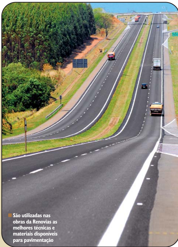
São utilizadas nas obras da Renovias as melhores técnicas e materiais disponíveis para pavimentação

De acordo com Canabrava, os trabalhos contemplam também a recuperação de 17 trevos ao longo da SP-340. “Isso trará melhores condições de acesso às cidades, distritos industriais e bairros rurais”, conclui.