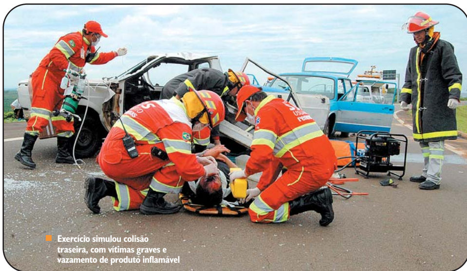
■ Exercício simulou colisão traseira, com vítimas graves e vazamento de produto inflamável